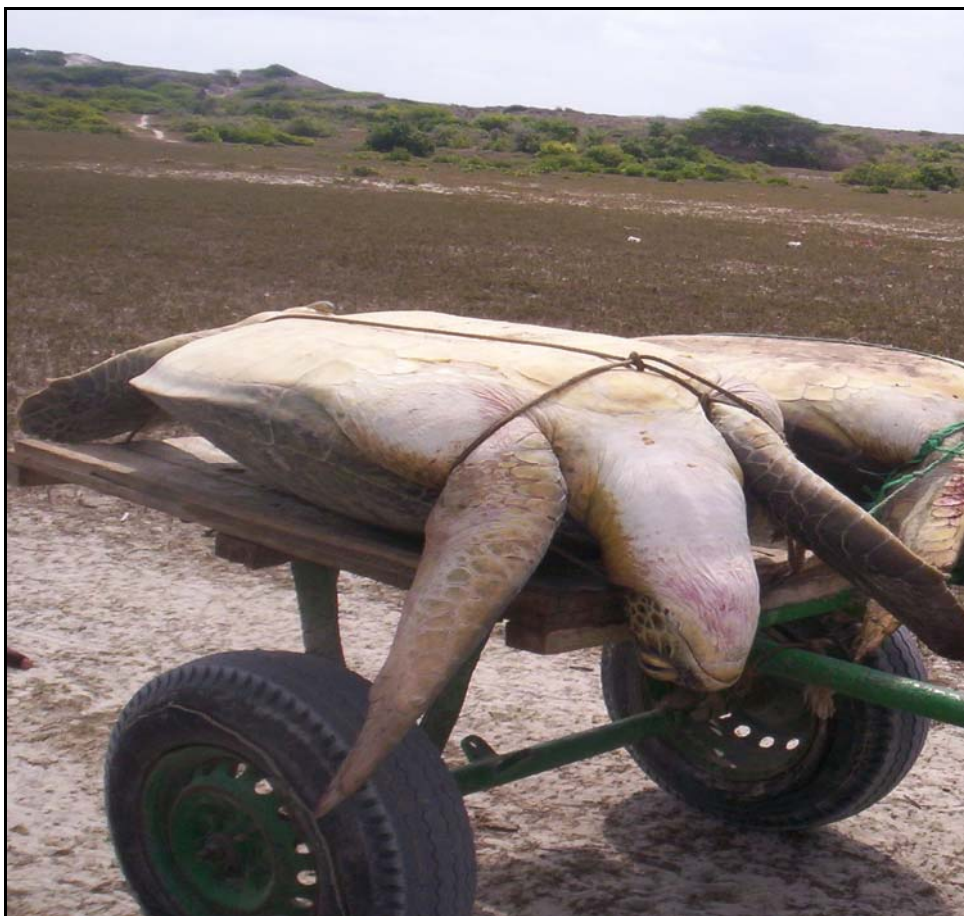
Ulovlig havskilpaddefangst på Chula

Mattradisjonene blant kenyanske og somaliske bajunier er relativt like, men den italienske kolonitiden 5 har satt sine spor i matveien, og bruken av pasta er vanlig blant somaliske bajunier. Ris og karri er for øvrig grunnstammen i det bajuniske kjøkken. Ris brukes dessuten mye sammen med kokos. Ellers er fisk, skilpadde, injera , 6 roti 7 og maisgrøt viktige matvarer. Hoho , en slags lefser laget av mel og vann, er også vanlig på de somaliske Bajuni-øyene. Faza 8 er en annen rett som er vanlig på Chovai. I likhet med somaliere flest drikker man te, men i tillegg også kokosmelk.