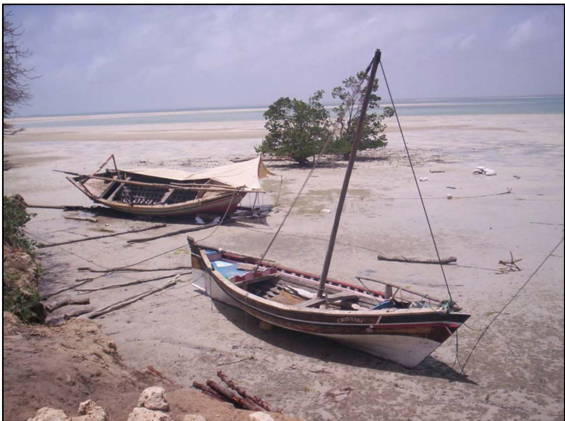
Tradisjonelle fiskebåter på en av øyene

De tradisjonelle båtene har alle påmalt bumerke i baugen. For de somaliske Bajuni-øyene er dette et øye ( iyo ).