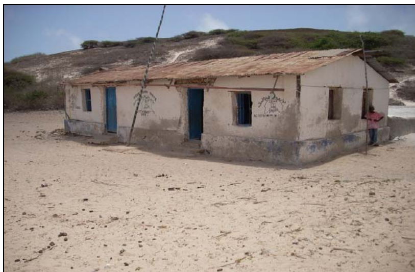
Skole på Chovai

Da flere av lokalsamfunnene på kysten ble angrepet av lokale somaliske klanmilitser på slutten av 1980-tallet, søkte mange bajunier tilflukt på sine opprinnelige hjemsteder – øyene. Et større antall bajunier ble i regi av UNHCR repatriert til øyene fra 1997, men repatrieringsprogrammet ble avsluttet da sikkerhetssituasjonen i området ble forverret i juni 1999. Da flyktningleirene på kysten av Kenya ble stengt på slutten av 1990-tallet, vendte også flere hundre bajunier tilbake til øynene (UNCT 1999).