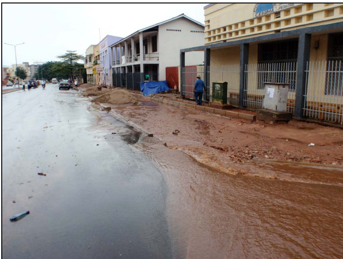
Gate i Bujumbura.

For å fange opp faresignalene har det internasjonale samfunnet fått på plass et varslingsystem med et telefonnummer som er gratis å ringe, hvor misligheter i forbindelse med valgene kan meldes inn. Det er dessuten etablert mekanismer i samarbeid med FN for å løse slike konflikter gjennom dialog.