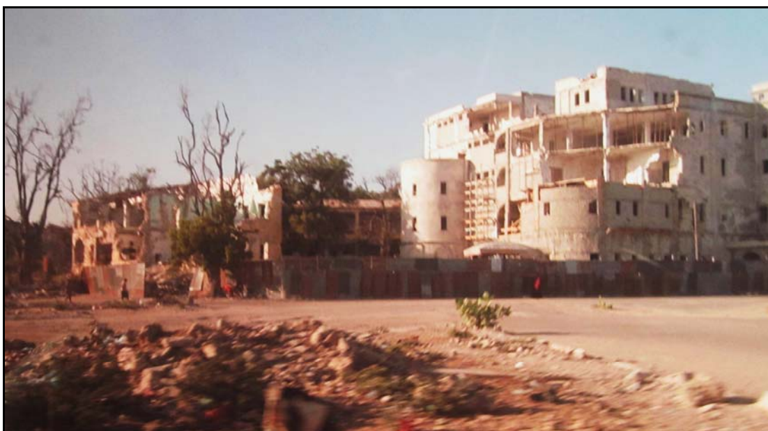
Sønderskutte bygninger preger gatebildet i mange bydeler.

Etter at Shabaab trakk seg ut av størstedelen av byen i august 2011 er artilleribeskytningen og de hyppige konfrontasjonene mellom Shabaab og AMISOM i sentrale deler av byen ikke lenger en del av hverdagen. Samtidig er store deler av bebyggelsen i bydelene Shangani, Hawlwadag, Shibis, Wardingley og Bondheere ødelagt. Også områder i Karaan, Yaqshid og Abdelaziz er rasert, og mange