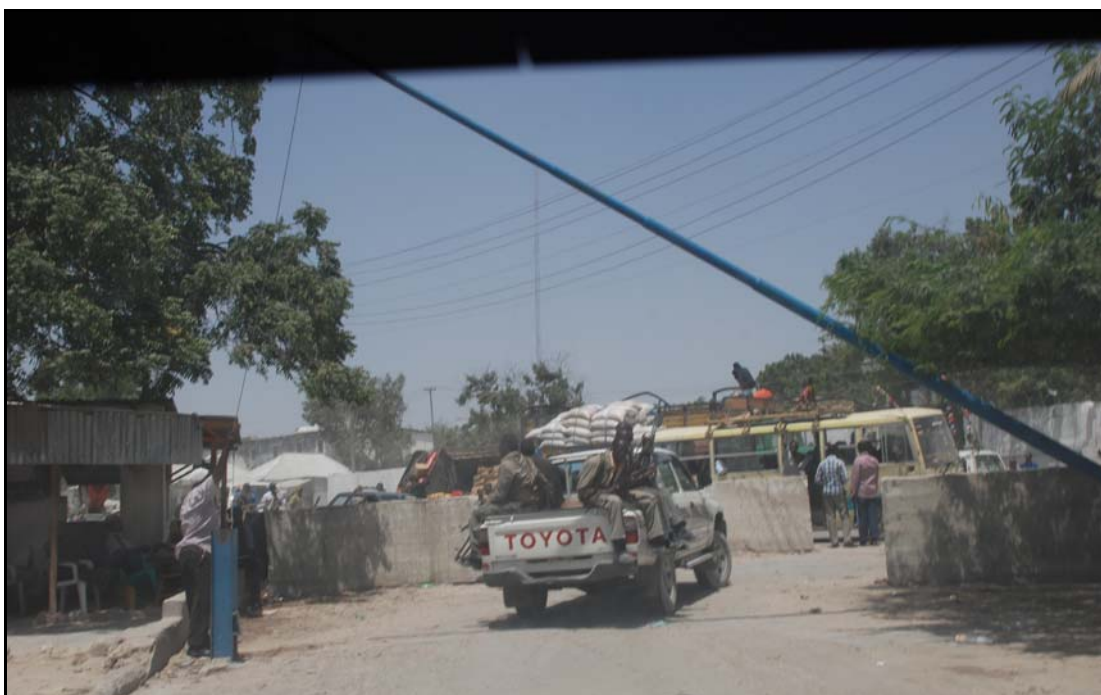
Veisperring i Mogadishu.

Landinfo var i Mogadishu i februar 2012, og fikk da muligheten til å se noen av veisperringene som er i hovedstaden. Betongbukker og sandsekker sikrer kontrollpostene, som hovedsakelig er plassert ved strategiske trafikknutepunkt og offentlige bygninger, både for å kontrollere passerende og for å innkreve skatt av handelsfolk. I tillegg til de offisielle veisperringene, har enkelte bydelsadministrasjoner og deres militser opprettet veisperring i ulike bydeler. Ved disse kontrollpostene og andre veisperring opprettet av bevæpnede menn – deriblant også folk som åpenbart er regjeringssoldater – presses passerende for penger. Både Mogadishus borgermester og nasjonale myndigheter peker på dette problemet, men virksomheten fortsetter og bidrar til kriminalitet i byen (Shabelle Media Network 2012b).