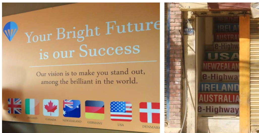
To eksempler på markedsføring av agentbyråer i Kathmandu, for studier i utlandet.

Tysklands ambassade (møte 2015) mente at hvilket land studentene søker seg til, for en stor del avhenger av hvor agentene anbefaler dem å studere.