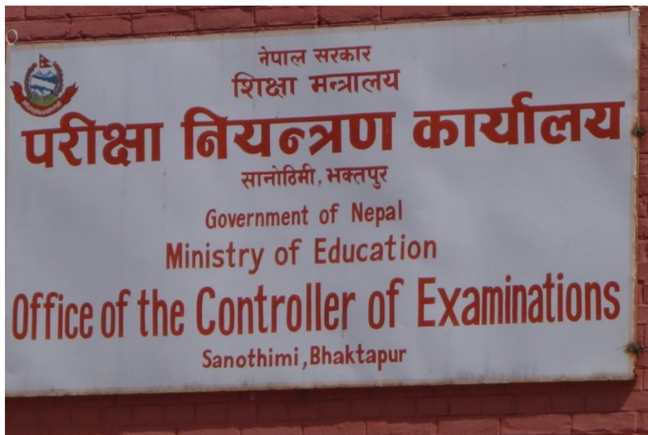
OCE-kontoret for SLC-eksamener i Bhaktapur, utenfor Kathmandu.

det hefter en viss usikkerhet ved dette årstallet, kan en legge til grunn at slike registre har eksistert i minst ti år. Dette kan karakteriseres som noe overraskende i et land som i svært liten grad har elektroniske og sentrale registre, heller ikke for dokumenter som for eksempel fødsels- og vigselsattester eller ID-kort ( Citizenship Certificate ).