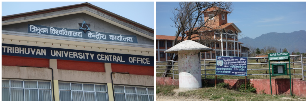
Tribhuvan universitetet i Kathmandu, Kiritpur.

colleges , og disse har 257 200 studenter. Dette betyr at Tribhuvan i studieåret 2014/2015 har noe over 400 000 studenter, når en regner med alle universitetets filialer og de private Tribhuvan-tilknyttede utdanningsinstitusjonene til sammen (Tribhuvan, møte 2015; Tribhuvan u.å.). Dette utgjør 85 prosent av alle studenter i Nepal (Tribhuvan, møte 2015).