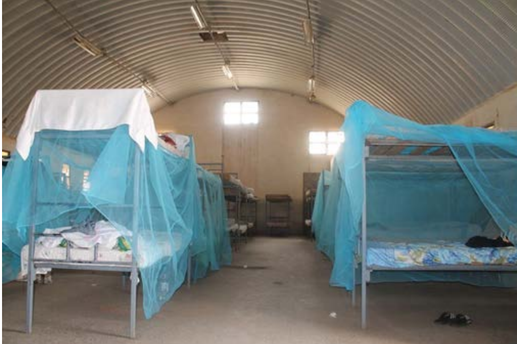
Sovesal i Sawa. Bildet er tatt sommeren 2014.