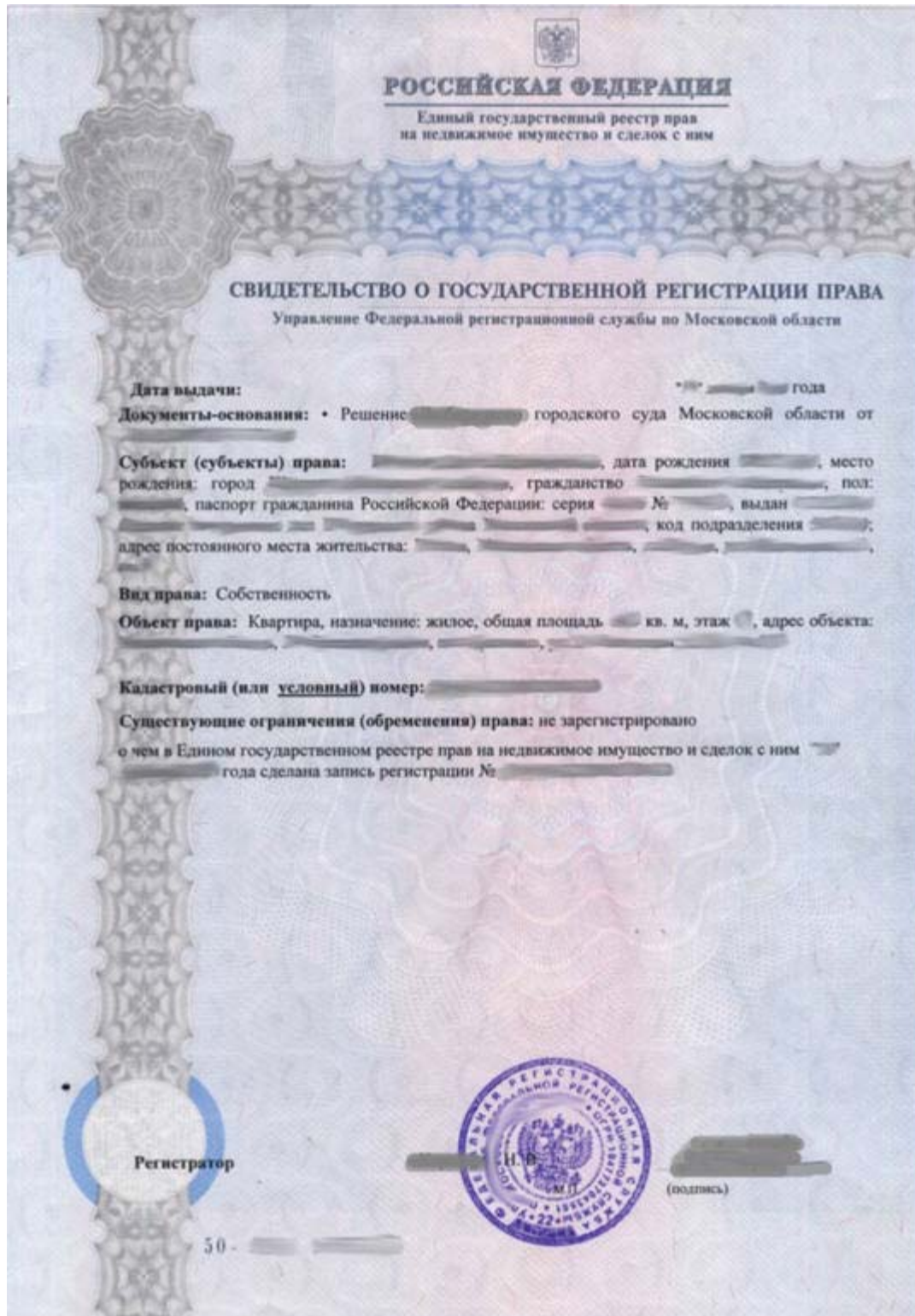
Vedlegg 1: Bevis for statlig registrert rettighet til eiendom.