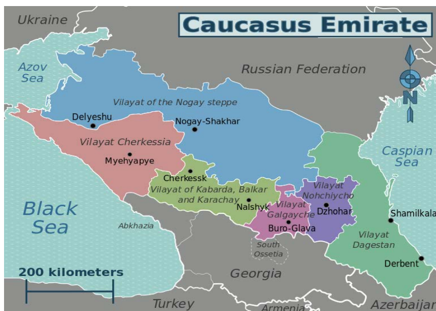
(Illustrasjon av Arnold Platon, gjengitt i Wikipedia 2013)

Organisatorisk og militært er emiratet inndelt i ulike fronter/provinser, eller vilayats (arabisk: provins), som i all hovedsak korresponderer med de politisk-administrative grensene i regionen: Vilayat Dagestan, Vilayat Nokhchicho (Tsjetsjenia), Vilayat Ghalghaycho (Ingusjetia og Nord-Ossetia), Vilayat Kabarda, Balkaria og Karachay og Vilayat Nogai 26 (Hahn 2010; Jane's World Insurgency and Terrorism 2013).